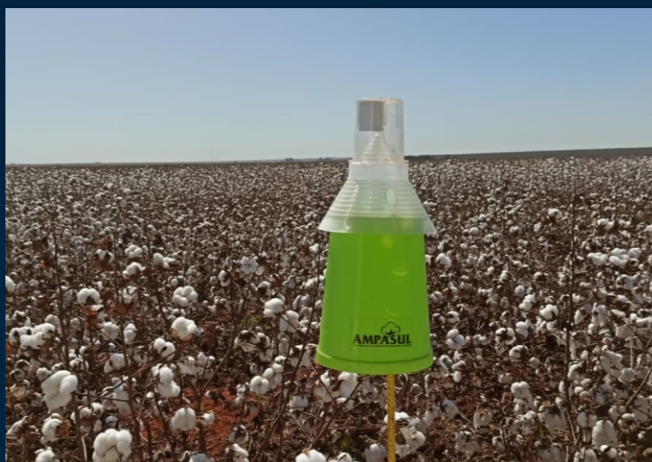
Figura 2. Armadilha para o bicudo-do-algodoeiro

A Ampasul reforça a importância de manter o rigor no controle do inseto até mesmo após a colheita, realizando as aplicações de inseticidas na destruição de soqueiras.