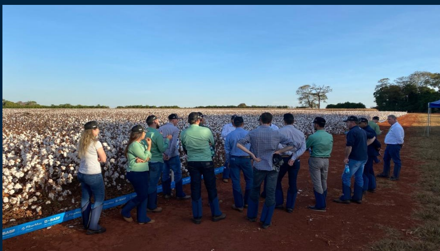
Figura 6. Equipes técnicas do MS em visita à unidade experimental da Basf

No dia 22 de junho a Ampasul juntamente com a equipe técnica de seus associados, participou de uma visita técnica na unidade experimental da Basf em Trindade - GO, com foco no melhoramento genético da cultura do algodoeiro.