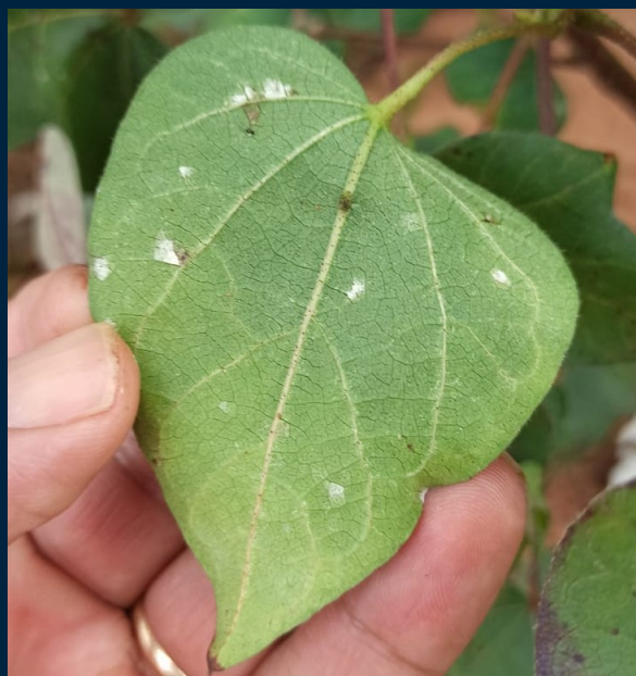
Figura 3. Sintomas de Mancha-de-ramulária

Em Campo Grande a cultura está em sua fase final de ciclo, e indica boa produtividade. Durante a visita foi identificada a presença de percevejos migrantes, que estão danificando os botões florais do ponteiro. Para um controle efetivo dessa praga, é de extrema importância o monitoramento das áreas, e a aplicações combinadas de inseticidas.