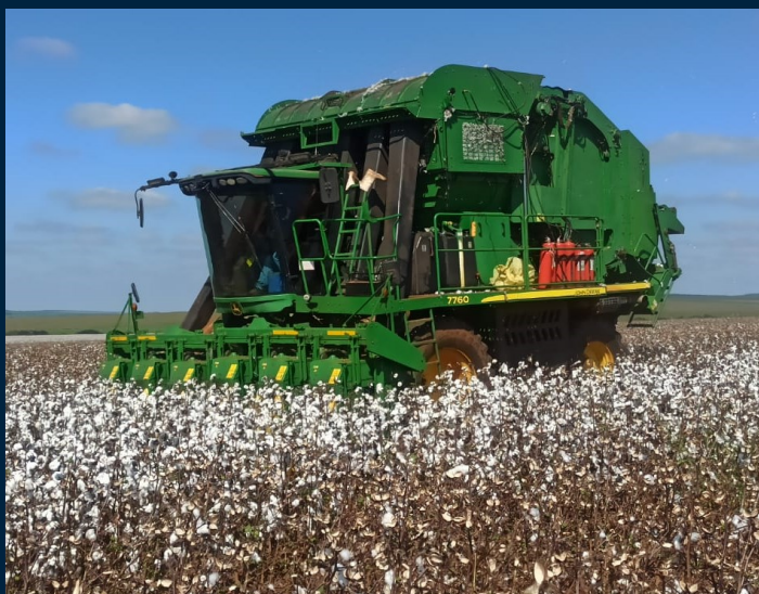
Figura 1. Colheita do algodão no município de Bandeirantes

Com o início da colheita do algodão na região, é importante que os produtores fiquem atentos a dispersão de pragas nas áreas de algodão 2ª época, realizando monitoramento constante, e as intervenções necessárias.