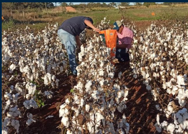
Figura 4. Colheita manual do campo demonstrativo de cultivares

A colheita dos campos demonstrativos de cultivares de algodão de Campo Grande e São Gabriel do Oeste foi finalizada no mês de Junho, com isso, todos os campos instalados em parceria com as instituições de pesquisa foram finalizados. O beneficiamento e a classificação do algodão deve acontecer no mês de julho, e os resultados das variedades, como: produção, rendimento, comprimento, micronaire, índices de fibras curtas, entre outros, serão divulgados assim que possível.