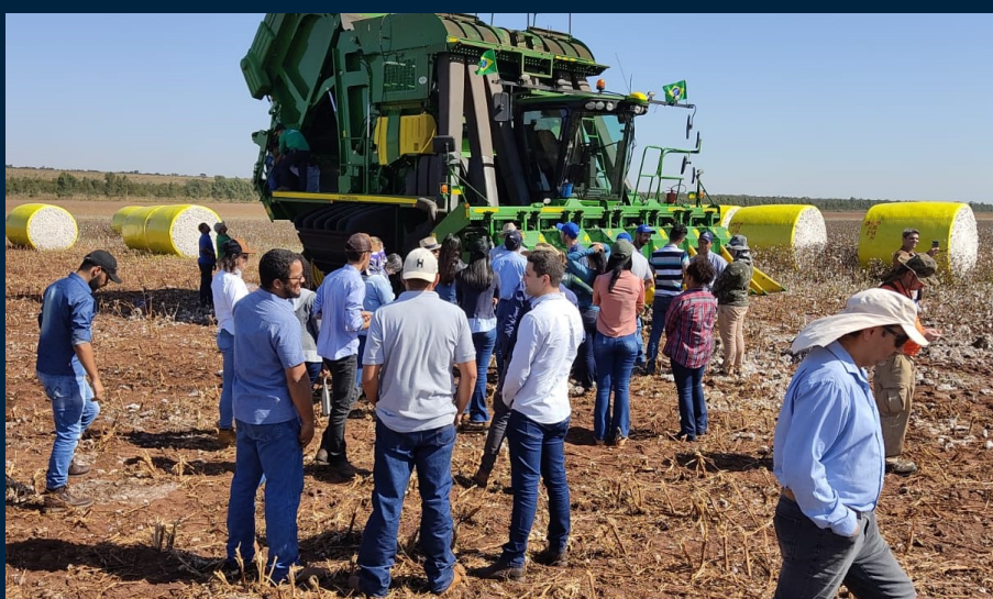
Figura 5. Acadêmicos da UFG em visita à lavoura de algodão

A Ampasul recebeu no dia 16 de junho os acadêmicos do curso de agronomia da Universidade Federal do Goiás, que puderam acompanhar a colheita do algodão no município de Paraíso das Águas, além de conhecer o moderno laboratório de análise de fibras da associação, que atende todos os produtores do Estado.