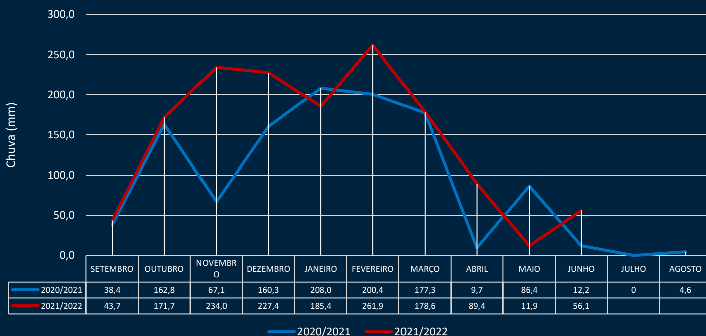
Gráfico 2. Índices Pluviométricos da Região da Baús

Comparativo pluviométrico das safras 2020/2021 e 2021/2022 Região da Baús - Costa Rica